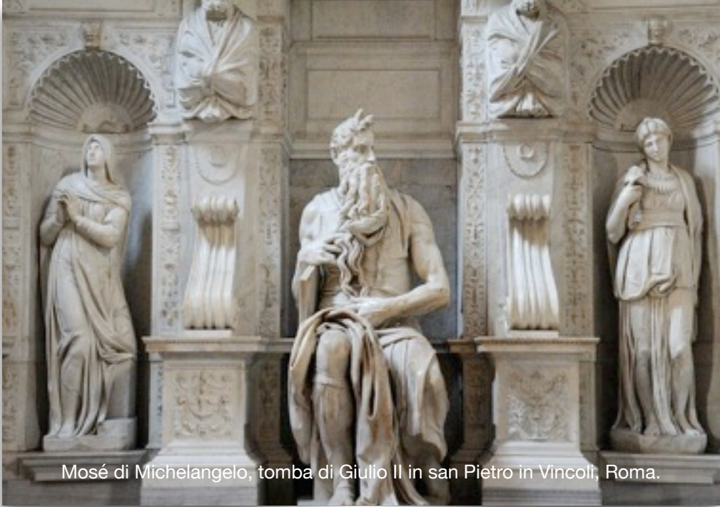
Mosè di Michelangelo, tomba di Giulio II in san Pietro in Vincoli, Roma.

Il suo primo tentativo di rivolta è fallito, ma questo fallimento diventa una grazia che lo trasforma profondamente e lo prepara alla sua futura missione.