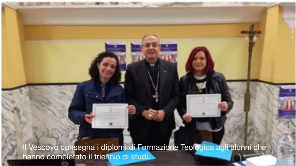
Il Vescovo consegna i diplomi di Formazione Teologica agli alunni che hanno completato il triennio di studi.

rinnovata missionarietà. Oggi la missione evangelizzatrice è un'urgenza della chiesa e il pontificato di Papa Francesco è fortemente marcato da questa visione, la visione di una chiesa in uscita e missionaria. Profeticamente, nell'intervento alle Congregazioni Generali che il cardinale Bergoglio tenne prima di essere eletto papa, egli commentava il brano della Apocalisse "Io sto alla porta e busso" (Ap. 3,20) come Gesù che bussava alla porta della chiesa desideroso di uscire fuori per incontrare il Suo popolo. L'urgenza evangelizzatrice scaturisce dalla "rottura della trasmissione generazionale della fede nel popolo cattolico" (EG 70) dovuta a una molteplicità di fattori, tutti concorrenti in varia misura a interrompere la trasmissione della